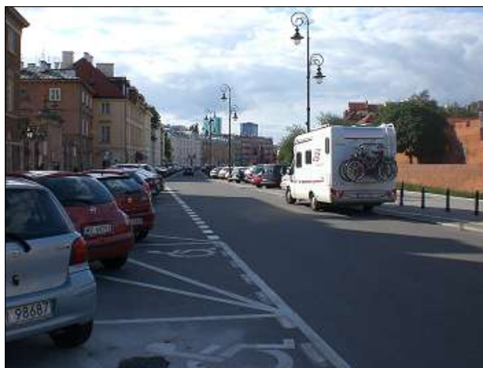
otoczenie / dojazd