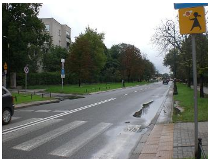
otoczenie / dojazd