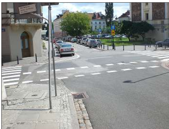
otoczenie / dojazd