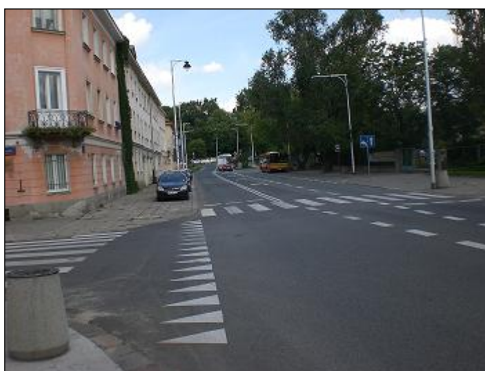
otoczenie / dojazd