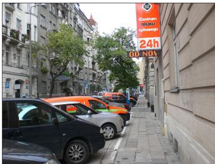
otoczenie / dojazd