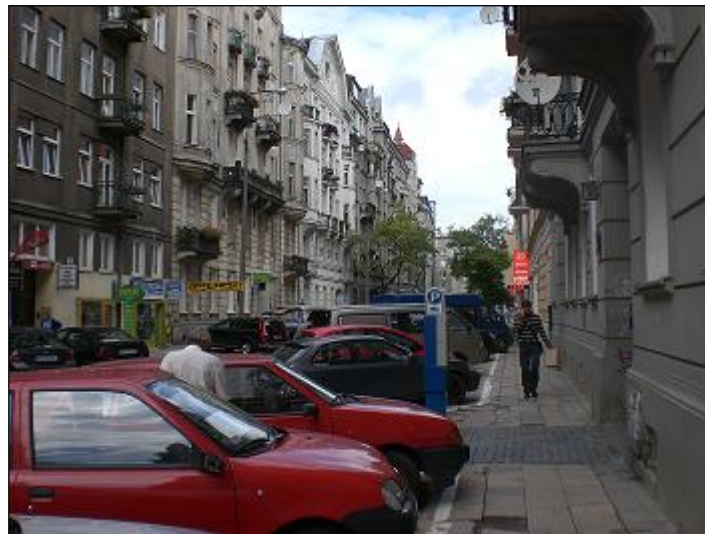
otoczenie / dojazd