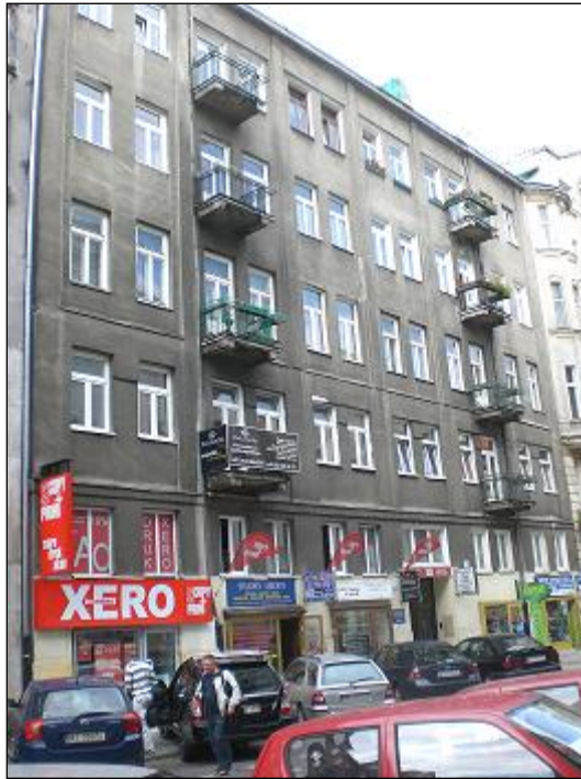
przedmiotowa nieruchomość - ul. Lwowska 9