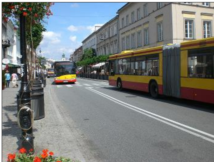
otoczenie / dojazd