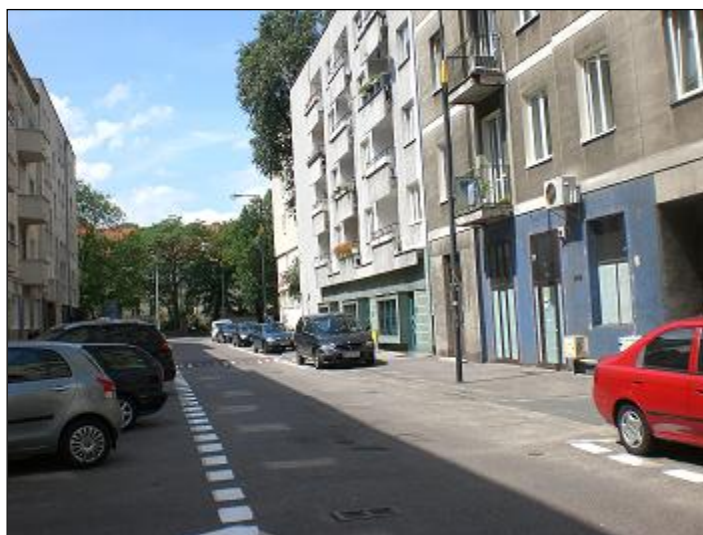
otoczenie / dojazd