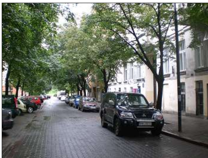
otoczenie / dojazd