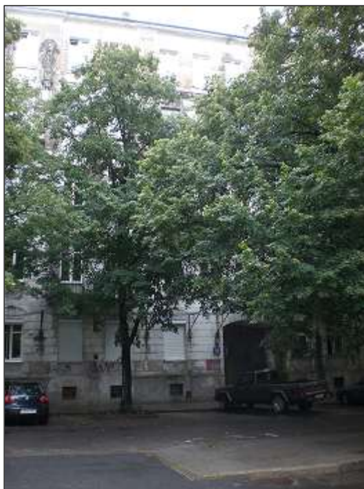
przedmiotowa nieruchomość - frontowa elewacja ul. Radna 11