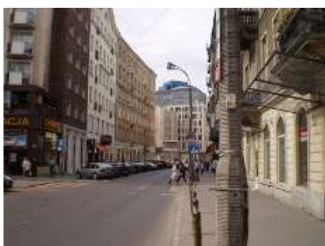
droga dojazdowa najbliższe otoczenie