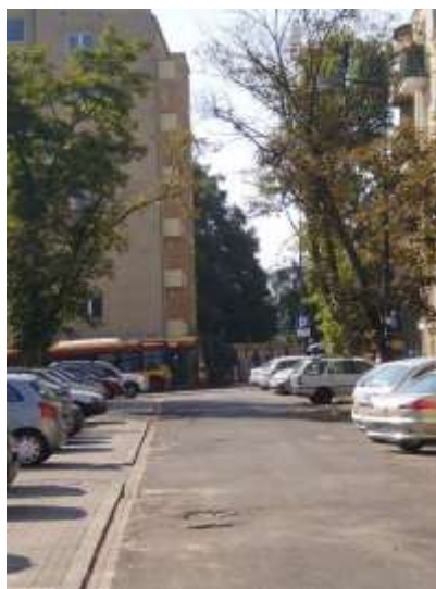
Droga dojazdowa i najbliższe otoczenie