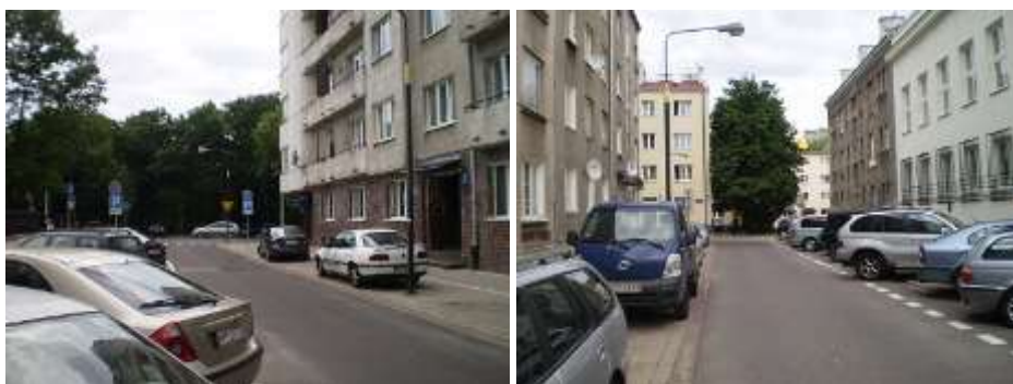
droga dojazdowa najbliższe otoczenie