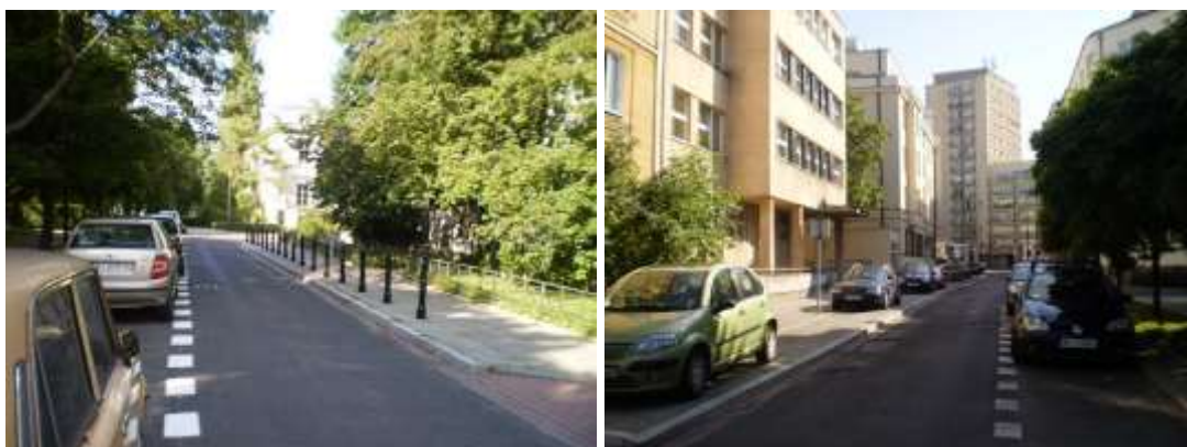
Dojazd i otoczenie