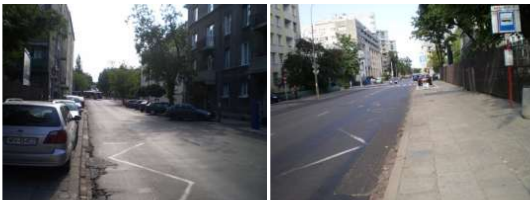
Droga dojazdowa i otoczenie