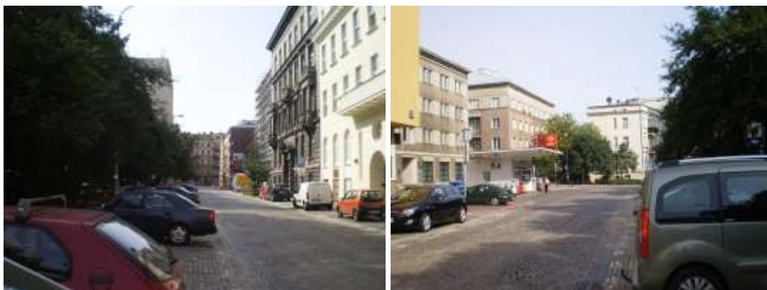
Droga dojazdowa, najbliższe otoczenie