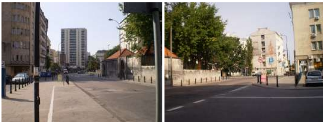
Droga dojazdowa, najbliższe otoczenie