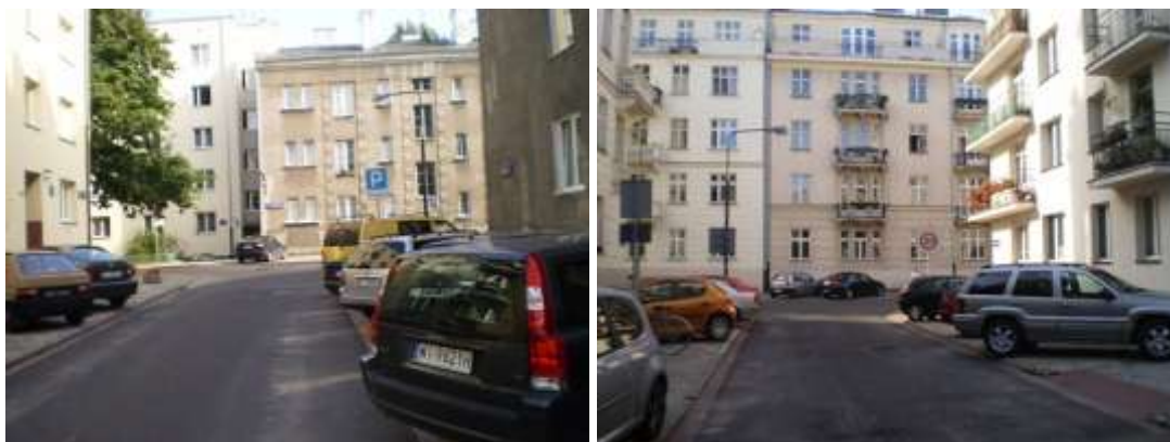
Droga dojazdowa oraz najbliższe otoczenie