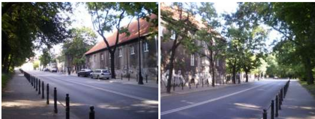
Dojazd i otoczenie