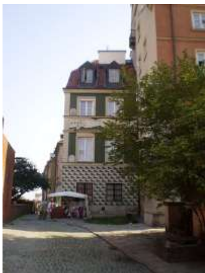
Droga dojazdowa i najbliższe otoczenie