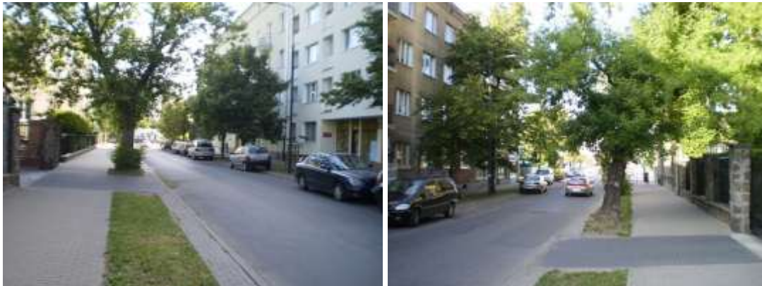
Dojazd i otoczenie