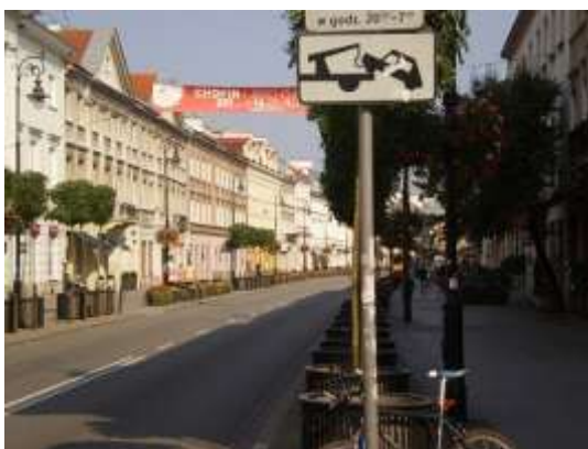
Droga dojazdowa, najbliższe otoczenie