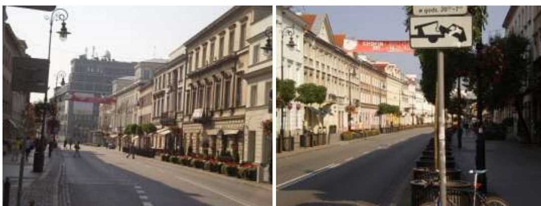
Droga dojazdowa, najbliższe otoczenie