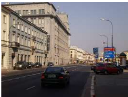
Droga dojazdowa, najbliższe otoczenie