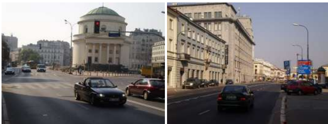
Droga dojazdowa, najbliższe otoczenie