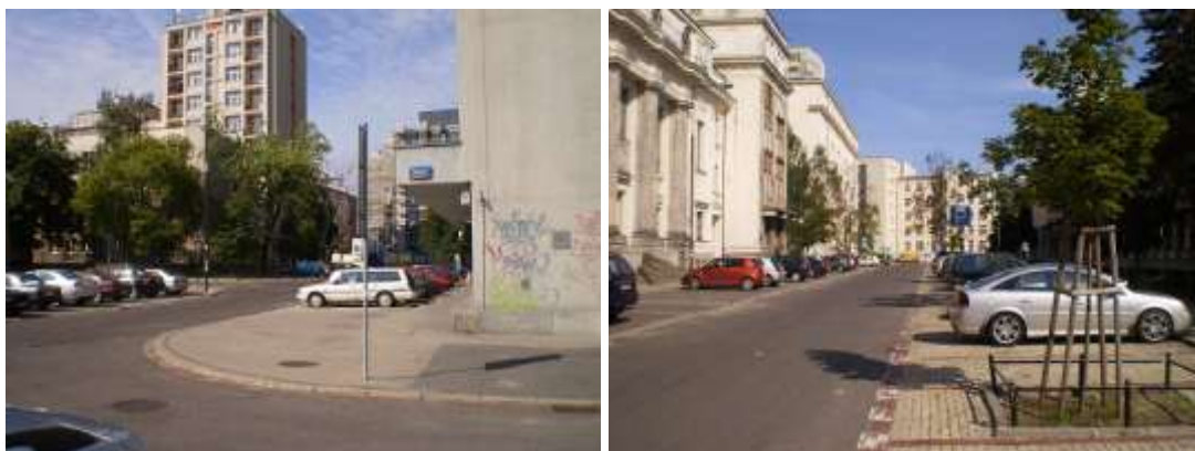
Droga dojazdowa, najbliższe otoczenie