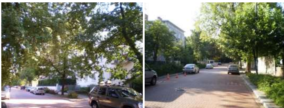
Droga dojazdowa i otoczenie