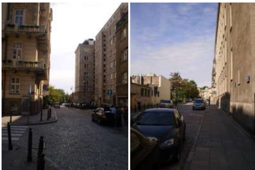
Droga dojazdowa i najbliższe otoczenie