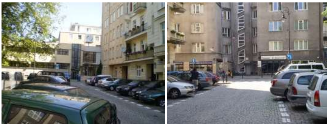
Droga dojazdowa i najbliższe otoczenie