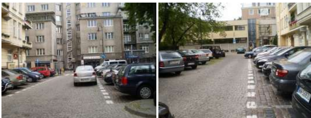
Dojazd i otoczenie