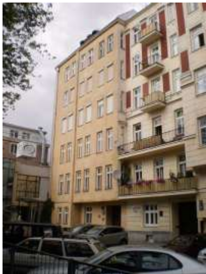
Stan zagospodarowania oraz sąsiedztwo