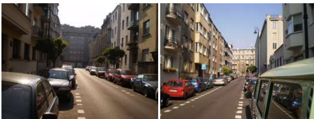
Droga dojazdowa i najbliższe otoczenie