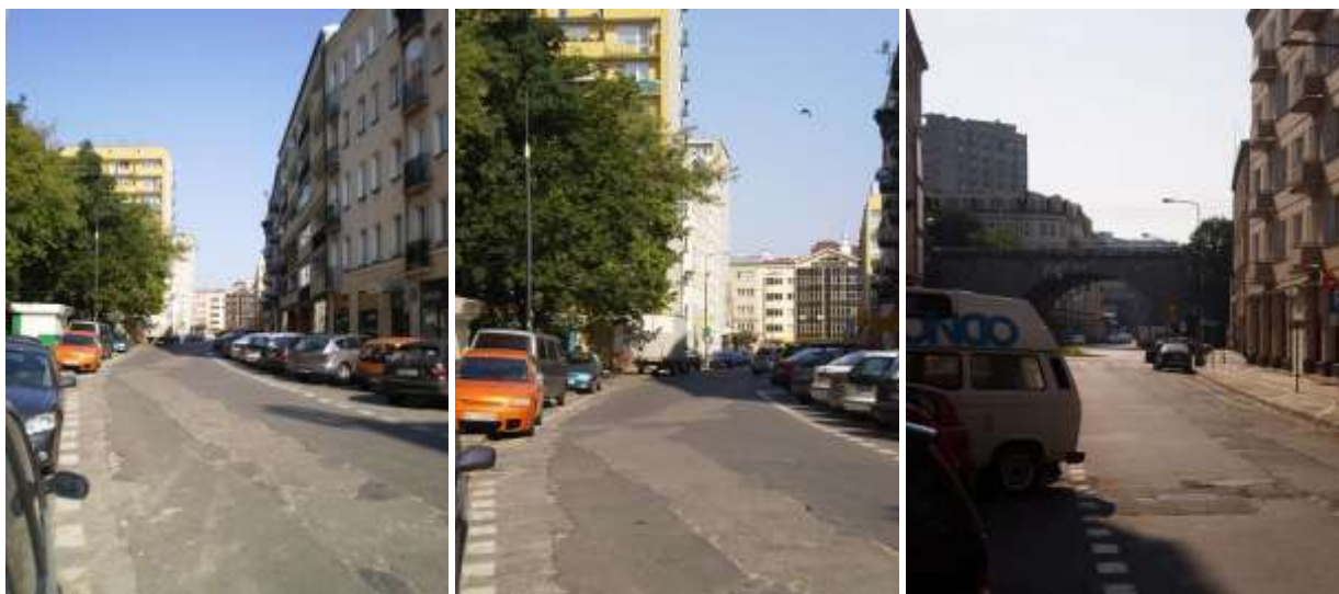
Droga dojazdowa i najbliższe otoczenie