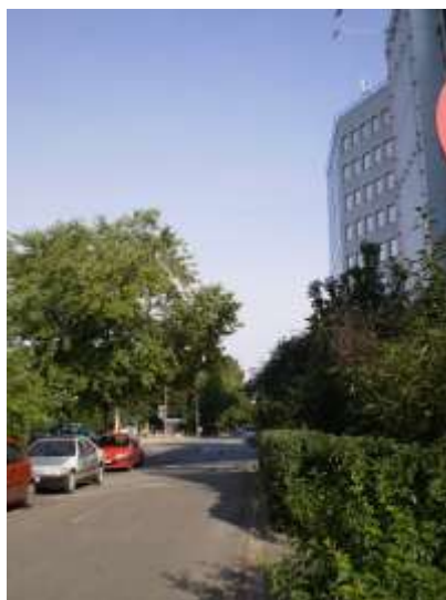
Droga dojazdowa najbliższe otoczenie