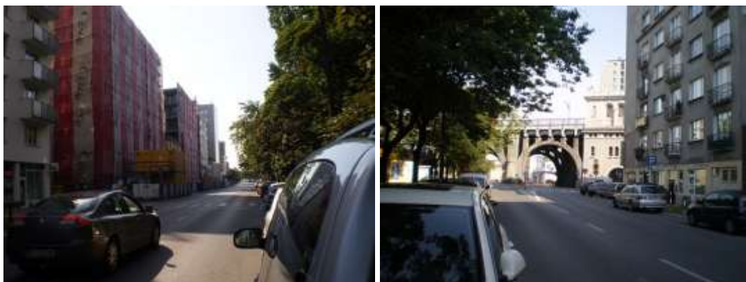
Droga dojazdowa, najbliższe otoczenie