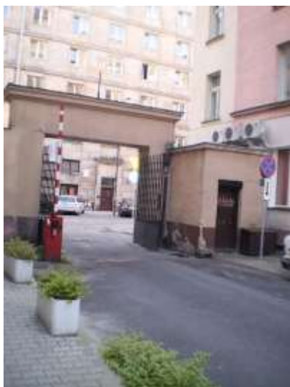
Droga dojazdowa i najbliższe otoczenie