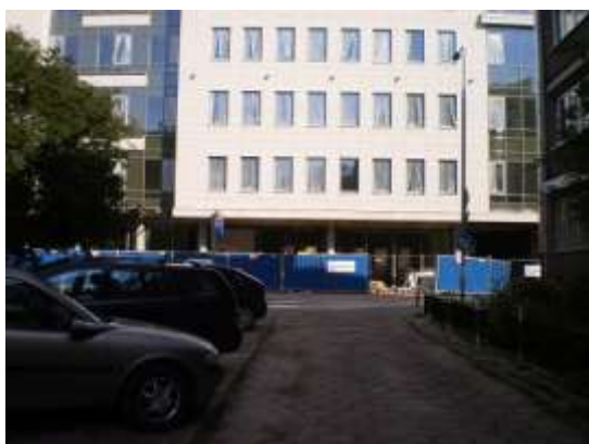
Droga dojazdowa i najbliższe otoczenie