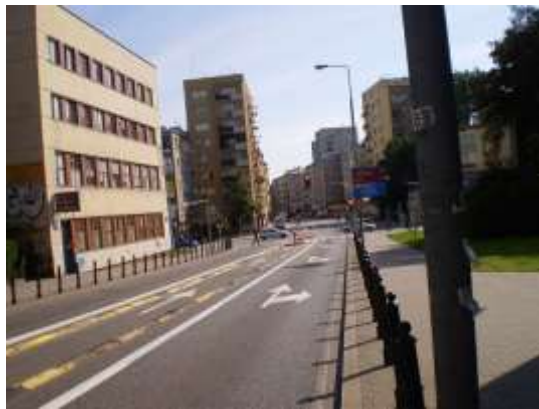
Droga dojazdowa i najbliższe otoczenie