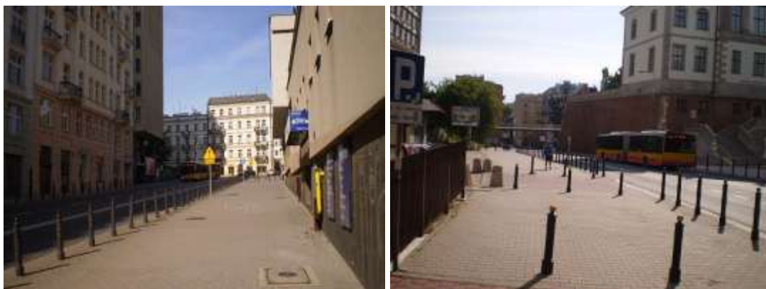
Droga dojazdowa i najbliższe otoczenie