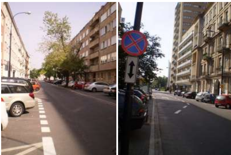
Droga dojazdowa, najbliższe otoczenie