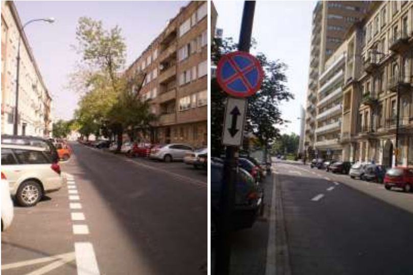
Droga dojazdowa, najbliższe otoczenie