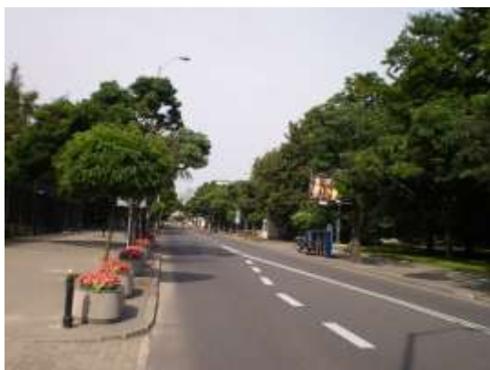
Droga dojazdowa, najbliższe otoczenie