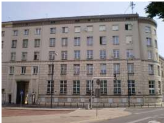
Stan zagospodarowania – widok od ulicy Wiejskiej