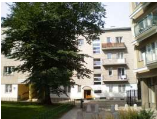
Stan zagospodarowania – widok od ulicy Wiejskiej