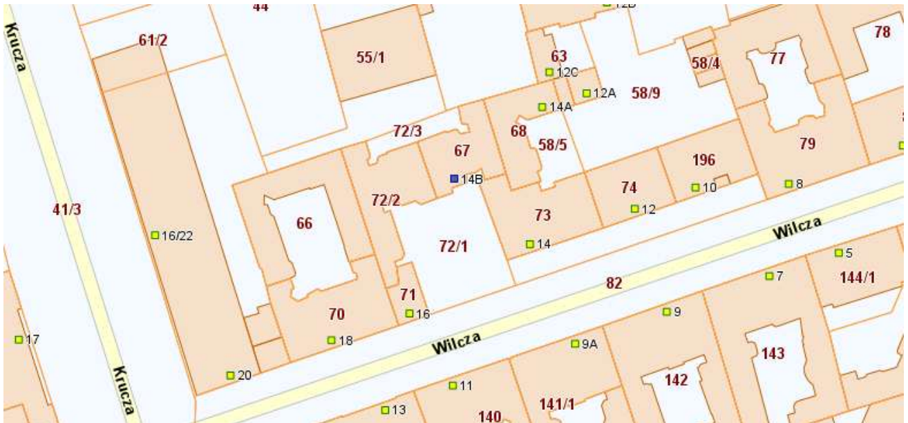
Fragment planu z mpzp