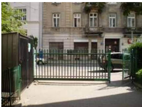
Droga dojazdowa i najbliższe otoczenie