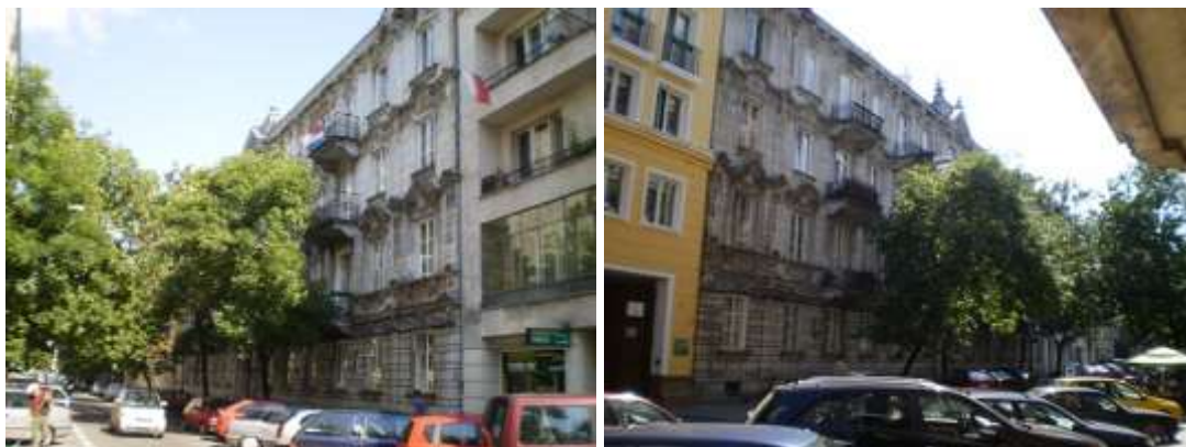
Stan zagospodarowania widok na zabudowę istniejącą na działce nr 92 (brak dostępu do działki nr 93)