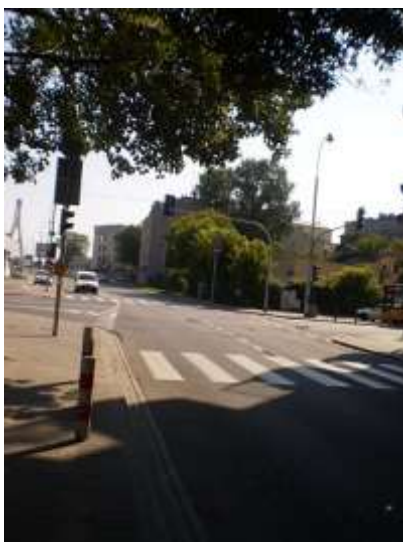
Droga dojazdowa i najbliższe otoczenie